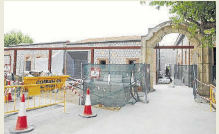
Las obras avanzan en El Roser.

como de su entorno. Las obras empezaron en octubre de 2019. La inversión está financiada al 50% entre el consistorio y la Unión Europea a través de los Fondos Europeos de Desarrollo Regional (FEDER) de Catalunya 2014-2020. Los trabajos suponen la renovación, adecuación y mantenimiento del valor y patrimonio natural. También significa el aumento de las zonas verdes de la ciudad, por ejemplo, con los más de 10.500 metros cuadrados que se gana con la construcción del Parc de les Olors. También destaca la creación del Jardí Agrari.