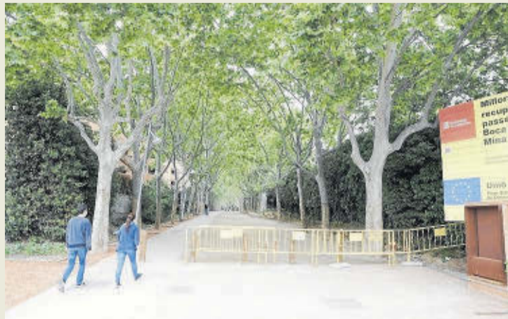
Estado actual del Passeig de la Boca de la Mina.