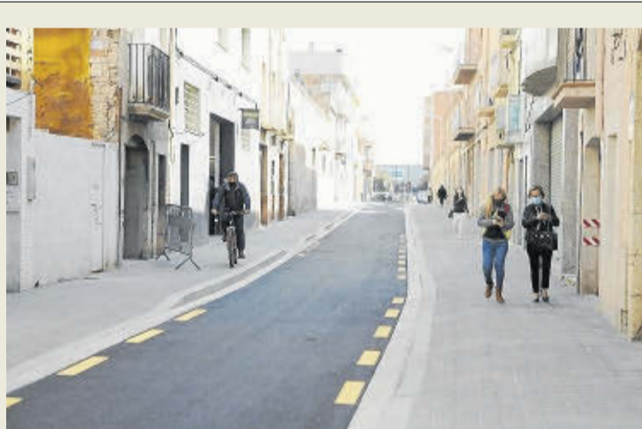
La reforma del Camí de Valls, finalizada.

La antigua prisión, ubicada en la carretera de Montblanc, se está transformando en un centro social municipal. El equipamiento rehabilitado contará con una sala de comedor social, con capacidad para 50 personas, y dos zonas de dormitorio, para albergar a 16 personas en riesgo de exclusión social. Después de tres años del inicio del proyecto, la ciudad tendrá un centro de urgencia social en el que también habrá despensa solidaria y un punto de gestión y distribución de la red de alimentos.